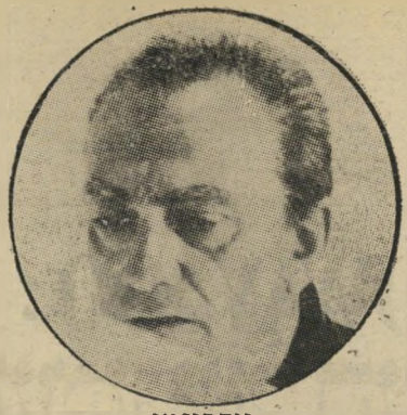
ויסקונטי - איפה החוויות

די מוריס בראו' - או ז'באר - או בואר - לעזאזל עם השמות של הבלגים האלה. השנה, המינשר הוא של לוקינו ויסקונטי.