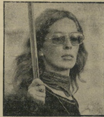
מאח תלמה יגול

"ארבע מאות מטוסים ינועו בשמי ה-ארץ בחג העצמאות" (מן העיתונות).