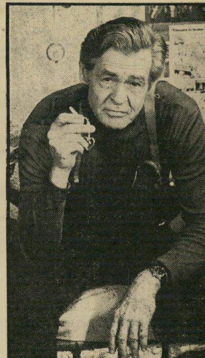
שחקן ראין פעם נבל, תמיד נבל

בעת ובעונה אחת, לא זנה את התיאטר-רון ולמרות שהיה קשה לו להופיע זמן ממושך באותה הצגה. הוא השיג כמה הצלחות יוקרה וביקורות נלהבות כבמסע ארוך לתוך הליה של א'ניל או בי-