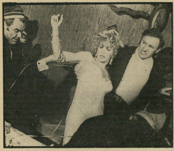
הקמו, סטיבנס ובורניין: הרפתקה מימית

הוא גם שומר על רמת-מתח סבירה, כאשר מצד אחד רודפים מייחים, הופצים פנימה לתוך האוויה, אחרי קבו-עת הניצולים, ומצד שני מכרסמת בהם איי-הידיעה כיצד להיחלץ מן המלכודת.