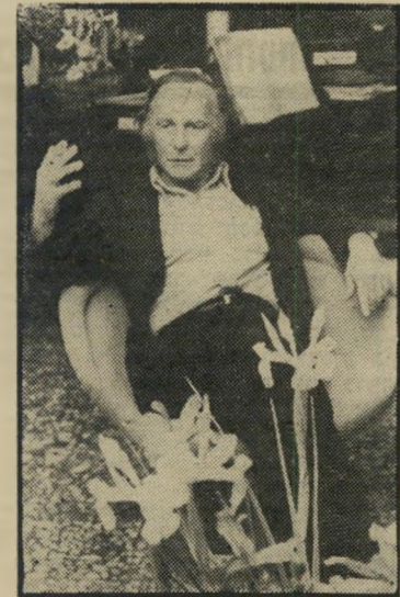
סוחר-אמנות סטרומ אפיק לכסף מיותר

או כמו אותו לילה: מישהו מצא אותי עם / הדיותי, יושבת על שער / חלוד בגן מטורף.