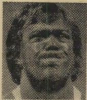
נחמן (אינוני מבריה) זורקי

דובר המיטרה שנשאל לפרש את החמרה בביקורת ה"מטענים, הסביר כי מקרה זה אינו יוצא דופן וכי לאחר רונה גערכות ב"קורות פתע לנהל גיום ברכב במטרה לסוחר (המובר) ב"דמם עולה על פי החוק. מותר על פי החוק.