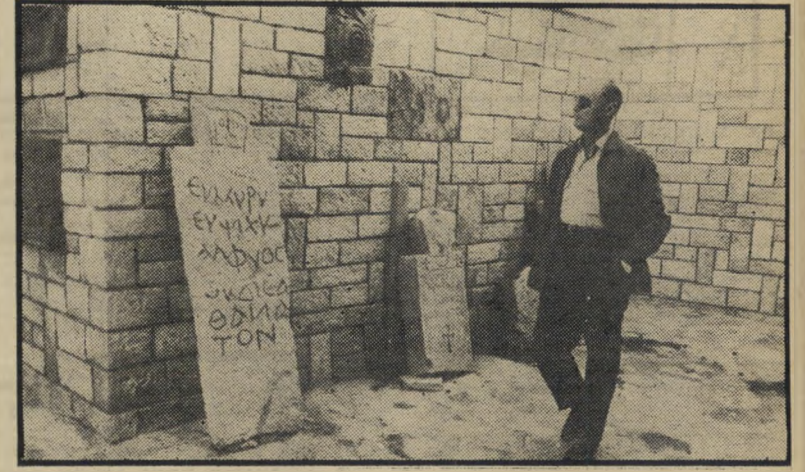
דיין ועתיקותיו בחצר ביתו מה שמותר ליופיטר, אסור לשור?

שבוע המשיך משה דיין לעמוד מעל ומעבר לחוקים המחייבים את שאר אזרחי המדינה. אלא שהפעם, הוא עשה זאת בצורה חוקית: משרד האוצר נתן לו אישור לכך. המדובר בסכום - קטן, יחסית להכנסותיו של שר הביטחון - של 7,500 דולר, שדין קיבל תמורת איוון מצולם שהעניק לסיכנות ידועות צרפתית. בניגוד לתקנות הקובעות במדינה, הירשה שריהאוצר לדיין לנהוג בכסף כך: הסכום חוייב במס-הכנסה מוגבל של 33% בלבד, כנהוג לגבי סופרים ואמנים. היתרה תופקד בבנק אוצר לחייל, ודיין יוכל לנצלה, כרצונו, למטרות רכישת עתיקות בחו"ל והבאתן לארץ. אזרח רגיל אינו יכול כמובן לחלום על תנאים כאלה. שכן אזרח רגיל חייב להמיר את הדולרים שהוא מרוויח בחו"ל בלירות ישראליות, לפי השער הרשמי - ולשלם עליהם מס-הכנסה מלא. היתר שניתן למשה דיין יעורר בעיות תקדימיות חמורות, מאחר שבעלי השפעה שונים יתחילו עתה להפעיל לחצים על האוצר לקבלת היתר דומה, בטענות כי מה שמותר ליופיטר, מותר גם לשור.