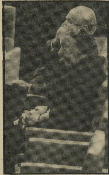
גולדה ושפירא בכנסת