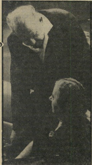
ברעם מתייעץ עם גולדה

בשעה 24.00 פשטה השמועה כי מיסדרונות: "הכלב גוסס!" חברי כנסת ועיתונאים התלוצצו איש עם רעהו, אנשי המערך וגח"ל התבדחו בגלוי על חשבון החיה הגוועת.