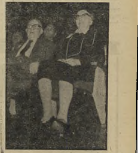
השנייה רחל ינאית בן-צבי, אשת יצחק בן-צבי, גברת מס. 2 השנייה של מדינת ישראל.