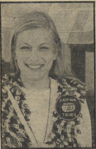
זמרת אידנית הצלחה ברגע האחרון