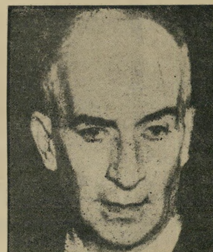
— והיום — כאבידירי הצלחה