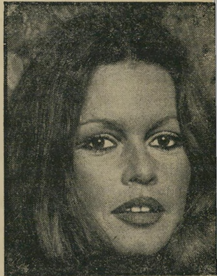
— והיום — משחקת כמו נעל

כל זה בא רק לחזקתה עד כמה אכזרי הזמן, כשהמזכיר בגורלן של כוכבות יפני פיות, שמראן החיצוני הוא הסחורה היחידה שיש להן למכור. ב.ב. שהיתה פעם סאנסציה, נאלצת