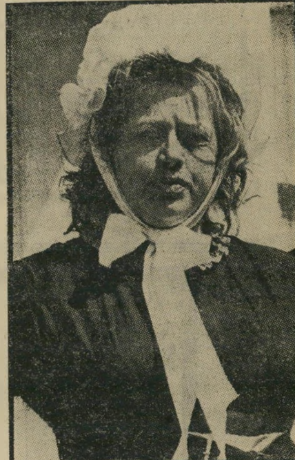
— והיום — שחקנית מוכשרת