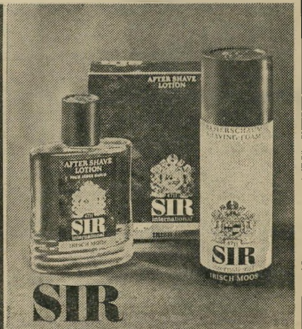
ני הקולון המפורסמים והמרעננים