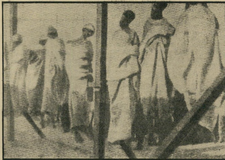
האימפריה האיטלקית: לובים תקינים בימי מוסוליני תל־אביב תפקד, מוריטניה תצייט!

אחרי דבריו של קדאפי, אין אדם נבון יכול לחזור על מליצה זו ברצינות ובכנות. כי קדאפי קובע עובדה פשוטה: הכמיהה להסדר מדיני, הקיימת גם בצמרת העולם הערבי וגם בי קרב המוני, אינה פרי הטכסיס של הרגע. היא מבטאת נכונות פנימית למתוח קו תחת האידיאלי דוגמה של שני דורות, ולכונן מצוי אות חדשה, המבוססת על ההשי למה עם קיום ישראל והתפתחותה. מי שמתעלם מכך, שותף לקדאפי בה תפיסה היסודית: שהשלום אינו רצוי.