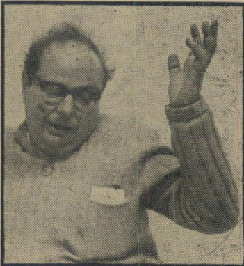
ישראל שחק הפועה מכובדת

הלב על הופעתו המכובדת בכנסת בזמן הדיון בפרשת יירוט המטוס הלובי, ועל מאמרו המצוין בפרשה זאת.