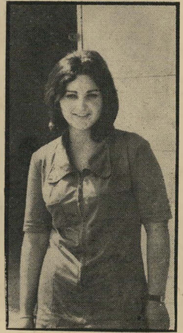
מנהלת-עבודה בוסקיה במושב שלה — עובדים ערבים

אולם, לדבריו, לא יקבלו פרדסי עזה פיצוי, כדוגמת הפרדסנים בישראל, בגלל שהמועצה לא דאגה לבטח את הפרדסים המקומיים נגד הקרה. ברור שמהדל זה לא יגביר את האהדת שיערי העיר לישראל. לא ש'ונאיים. ניתוח כלכלי זה, על המתרחש כיום ברצועה, מסביר את ה' התרחשויות המדיניות המתפתחות שם.