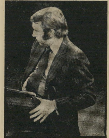
מראיין פרוסט מדינה לבנטינית