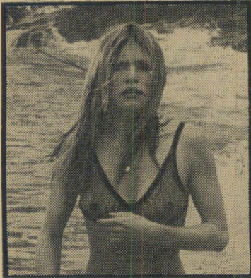
ברניז'ט בארדו הגורם: דון'ז'ואן

מנהלים רומן - בפריז, השחקנית הצרפתית ברניז'ט בארדו (38) והשחקן ז'ורן רג'יה (25). השניים הכירו