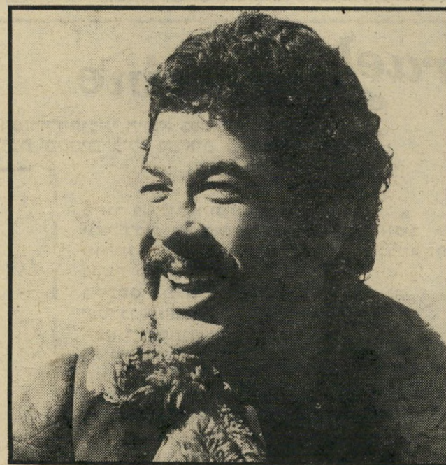
עדנה לב נרכשה ב־45 ל"י, דני גרנות בעשרים ל"י, שושיק שני בארבעים, אריק לביא - גם הוא מעשה ידיה של שושיק שני - ב־35. לזיגמונד פרויד היה ודאי הרבה מה לומר על התערוכה.