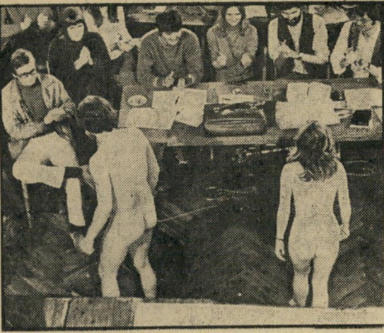
מדגימי מישגל בכיתה: וגם מוסר