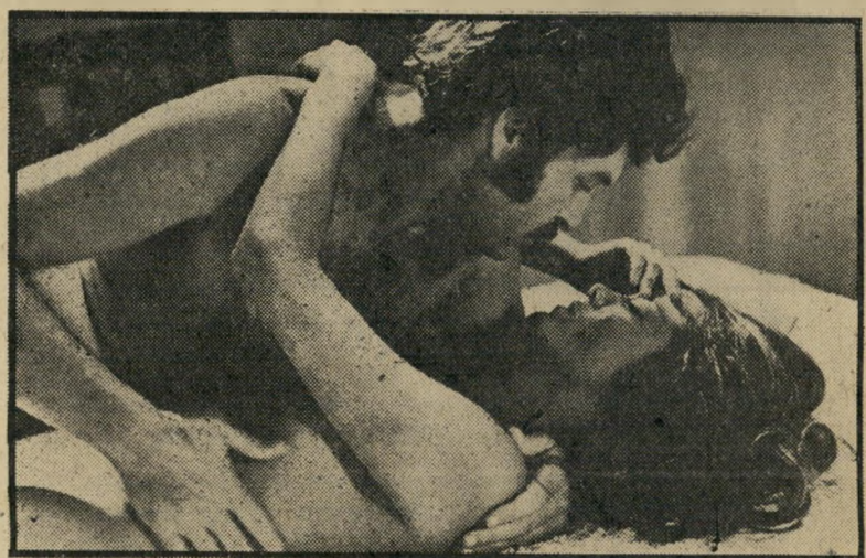
לוי על סמית ב"הצד השני" — או טבעיות ערומה

דבר ראשון שעשתה. אחרי שהכירה את אורי, היה לבדוק אם המול שלו מתר אים לשלה. כשגילתה שלא. היתה מרוצה.