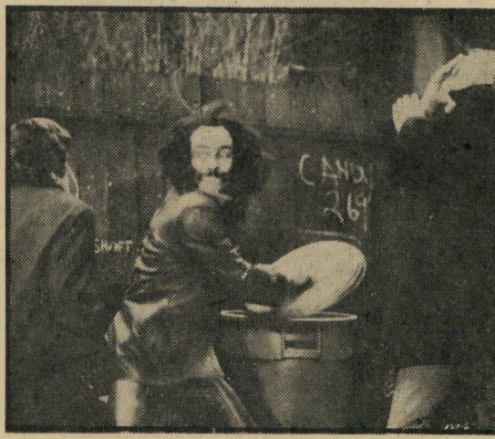
אוניל: כל השחורים אותו דבר

אלא שהערות אלה נמצאות במרחק כבד אחת מן השנייה, וביניהן מלא הבד בלינקולן הזוהרת ובסימ-טאות הכרך, מישגל ארוטי אחד, והרבה מאוד פיטפופטי