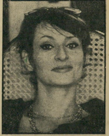
זמרת ברברה הצלחה תמוהה

בצרפת נחשב ברוננו קוקאטריס, מנהל האולימפייה לכהן הגדול של הפיזמון. פוסק עליון אשר על פיו יקום ויפול כוכב. בדרך כלל, אין עוררין על דעותיו והשקפותיו — ובעיקר לא על כושרו הנבואי ביחס לעתיד המיסחרי של זמרים. אבל פעם אחת לפחות טעה קוקאטריס טעות גסה כל כך, שעד היום מזכירים לו אותה: לפני שנים, באו אליו כל מיני אנשים, ממוריס שבאלייה ועד אדית פיאף ועד ז'אק ברל ועד ז'ורז' בראטנס, וסיפרו