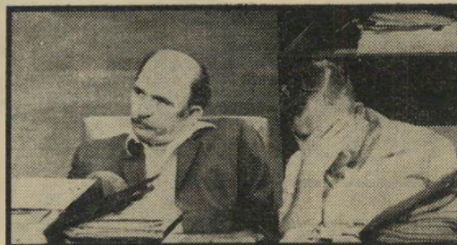
שר-הבריאות ויקטור שם-טוב

במיקרה הטוב ביותר מתנהג השר כאילו הוא דוגל בתפיסה אולטרה-ליברלית מן המאה ה-19. המיעדת ל-מדינה תפקיד של מין שומר-לילה, המפקח על הדברים, תחת שהמדינה תהיה אחראית לרווחה. לסעד ולבריאות של האזרח בה.