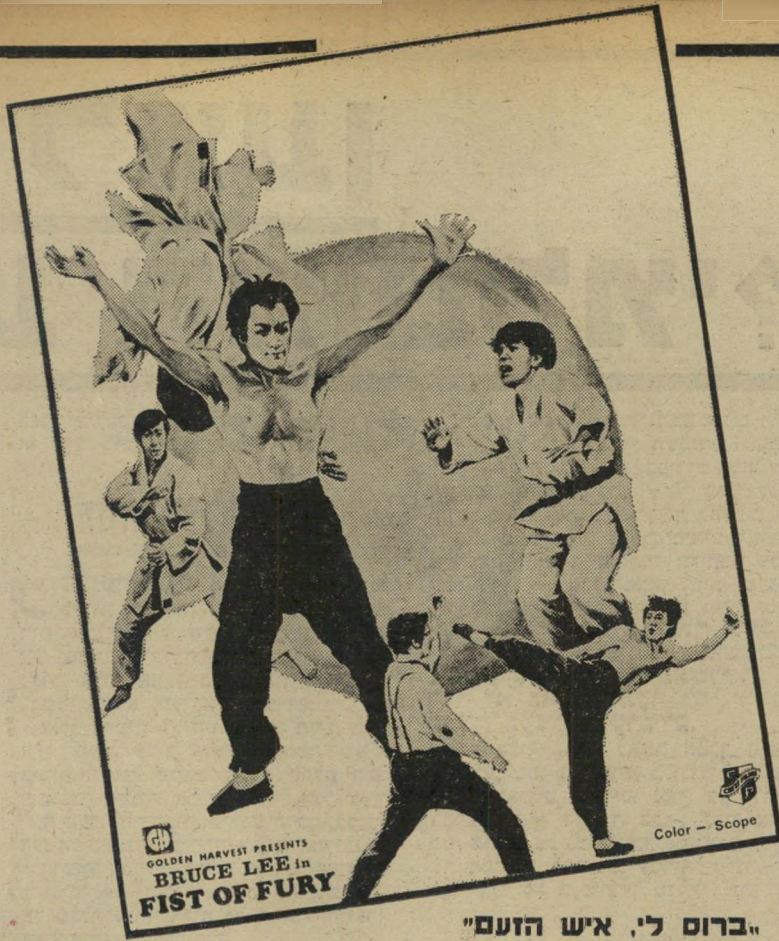
"ברוס לי, איש הזעם"

רבבות בנייהנוער והמבוגרים, שנתקפו בשבועות האחרונים בקדחת סירטי הקא-ראטה, עלולים להתאכזב קצת, למישמע דעתם החד'משמעית של המיקצוענים. אחרי הכל, בכל חברה טובה של החברה הטובים, ביום ובליל, משמשת כיום הדת החדשה נושא מרכזי לשיחה: אה, איזה חלום בהתגשמותו. אינך צריך עוד להיות גיבור ושרירי — אינך צריך עוד להתאמן שנים במשקולות — אינך צריך עוד אפילו סכין או אקדה. מעתה, עשה זאת במור ידך: מכה קטנה בכף ידך או רגלך, בתוספת זעקת'אימים מזדהדת — ואתה משתק כל יריב. איזה קיצור'דרך לאושר, לתהילה. איזו גלולת'קסמים ליהפך לגבר. ורק פגם קטן אחד יש בחלום הקוסם: שהוא רק חלום.