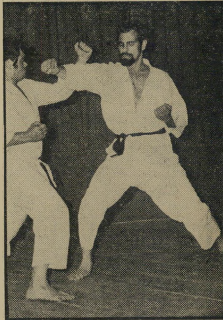
ריצקוף "הסרטים תסם ברוטא ליים", קובע ריצקוף, בעל מכון קאראטה זונק של 19 שנה בספורט. משמאל: הדגמה חיה.

ה כל שטויות! "זה בבלית, לא קאראטה!" "זה פסטיבאל של אלימות בשביל הי טיפשים!"