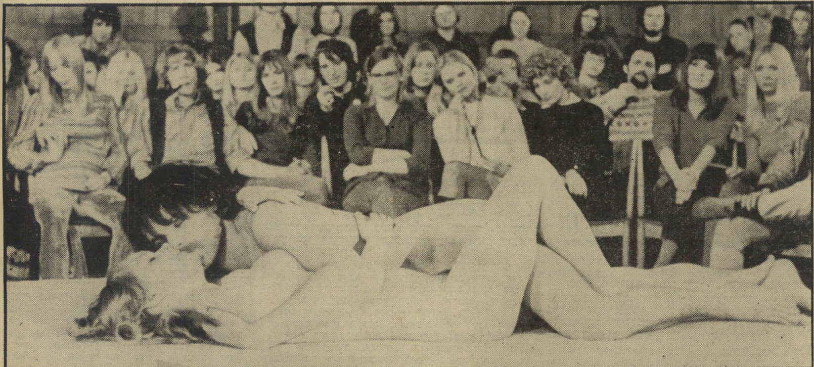
סטודנטים מתנדבים במעבדה לניסויים מיניים באוניברסיטה פרנסה משתלמת

כיתה, כך לומדים פיזיולוגיה באוניבר-סיטה. כל אלה — אליבא דהסרט אהבה נוסח קופנהגן* לפחות, כפי שמגלה אהבה זו סיציליאני לווהט — לא אחר מאשר לאנדו בואנקה, מי שסבל מעורף אשכים בהיותו ארוטיקוס, ועשה בשל כך שמות בכל גשות צפון-איטליה. הפעם, הוא סיציליאני המאמין כי דם ויקינג זורם בעורקיו. לאחר שהזדמן לו להתבונן בקצה הפחות-נעים של אקדה, שהופנה אליו עליידי בעל זועם בארץ-מולדתו, הוא מבקש ממעבירו, בעל בית-הרושת לגעליים, שיעביר אותו לדנמרק. שם, שמעו, הבעלים צוחקים כשהם מגלים גבר זר במיטתם. סוכן הנעליים שבא לדנמרק מגלה את המוסר הסקנדינבי בכל מערומיו — אך אינו יכול להתחיל לנצל את כל היתרון גות הנחשפים בפניו בגלל שתי מיגבלות. הפעוטה יותר: הוא אינו יודע את השפה. החמורה יותר: כשאין כבר צורך בשפה — תוקפים אותו מיחושייגב בדיוק ברגעים הקריטיים. * המוצג בקולנוע מקסים בתל-אביב — להוציא כחובן את התמונות דלעיל.