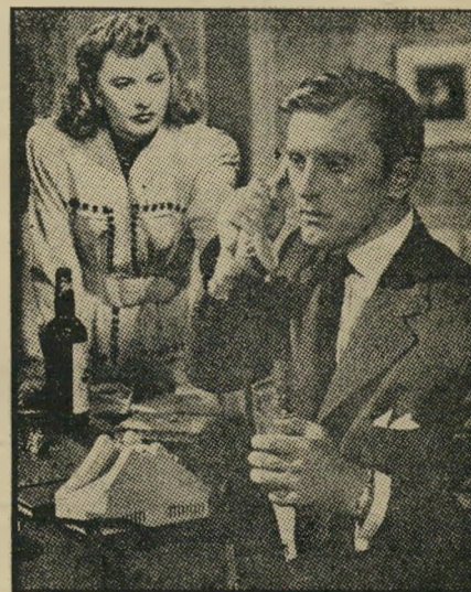
קירק דאגלס * כושי, לבן, ג'קיל, הייד

וזה אפייני-לאיש היעיל הזה, אמנם התחיל בשם היהודי-רוסי, אבל המיר אותו בשלבים די מוקדמים לשם מצלצל יותר, קירק דאגלס. מאז ומתמיד היה אדם נמרץ, שאינו נכנע בפני מאומה. כשחסר היה לו כסף לכלכלה, שעה שלמד באקדמיה לאמנויות דרמטיות, עבד כמתגושש