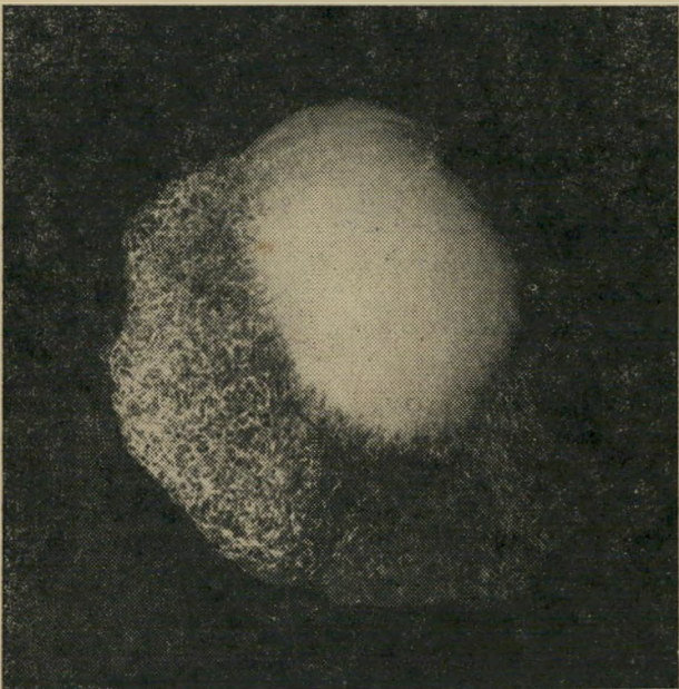
מגוון מיני חולייתנים שגילו כ-100 מיליון שנה. צילום מיקרוסקופי.