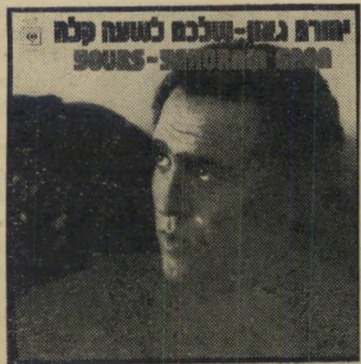
השעה של גאון בלי שאר-רוח

צוא להצדקתו של יהורם גאון והשירים שבחר לשיר, בזמן האחרון. בשלכם לשעה קלה (יהורם גאון, ס.י.א.ס 69026) גי"כרת פוילתו של יהורם למעריציו, ולא דווקא לטובה. כשהוא מגיש אווירה ים-תיכונית, על רמה ובמיקצועיות, גם ב"מלים (לדוגמא, מדוע לך, שירם של מוסיקאי והאדג'יקס בתירגומה של נעמי שמר) שיר של מלחין ומעבד מיקצועי (אגן ים-התיכון מאת משה וילנסקי) או שיר יפה אחר שכמו ניתפר לקולו ולמיזוגו של יהורם (סתיו מאת מוסטאקי ותיאודור רקיס) — זה טוב יפה ומומלץ לכל אוזן האוהבת מוסיקה. אלא שכל השאר, כולל שיר הנישמע כמו פארודיה על שיר פרי-טיונים רוסי, או הפארודיות שאינן מצחיקות, וצחוקות לבומבסטיות ולהשתפכות שאינן בדיוק תכונות הנעדרות מהופעותיו של גאון בעצמו, כל השאר הזה הוא ב"אמת שאר, ולא שאר-רוח.