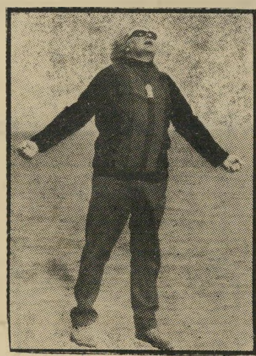
במאי ראפס משיח משוגע

המבקרים קברו את מוצארט בקבו אלמוני. הם האכילו את הוגו וולף ב צואתם כל חייו — עד שבסופו של דבר