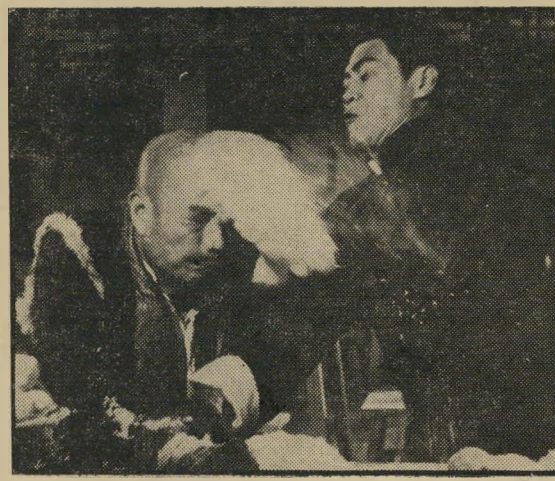
פינג ולי בפעולה: יותר מדי תרד

מי שניחן בתודעה קולנועית מינימלית, יזהה כמובן את מרבית התעלולים האתלטיים כמשחקים של מצלמה,