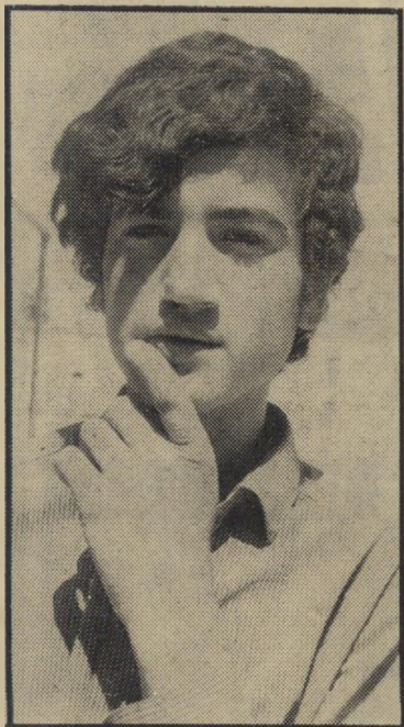
משותק אסולין עזרה לא נדבה

אלא שמאומה לא עזר, ופרחיה המשיכה לזכותה. היה זה בליל האחד בינואר, כאשר החליט עזין לחגוג את הולדת השנה החדשה במעשים, במקום דיבורים: שכנים מבוהלים הועיקו את מכבי-האש, אולם אלה לא הספיקו להציל הרבה. דירתה של פרחיה, על כל רכושה, הפכו לאפר. עזין נעצר, הודה בחקיירתו במטרה כי הוא זה שהצית את הדירה.