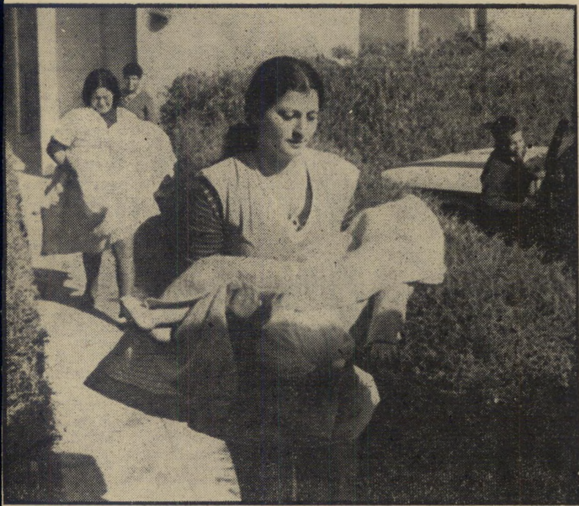
מטפלות מוציאות את גוויות הילדים, מוכי שיתוק המוחין, שנחנקו בשנתם במוסד בית-פנחס, כתוצאה מאדים מרעילים שנפלטו מתנור חימום של נפט. בחדר הסגור, ישנו אותו לילה תשעה ילדים, וארבעה מהם ניצלו.