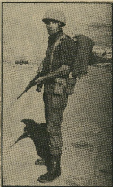
דורי כחייל ישראלי ואחיו התאום כחייל ארגנטינאי קשרים מסתוריים משני עברי האוקיינוס

הארגנטיני, חייב אחד מכל צמד-תאומים לשרת בצבא. יאר, שמצא עצמו קשור קשר עז לישראל, רצה להתגייס לצה"ל, סיכם עם אחיו שהאח ישרת בצבא ה"ארגנטיני.