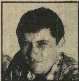
אייבי גילה פרובוקטור בן 200