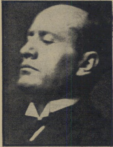
מוסוליני בחיים בלי אמצעי עזר —

פעם, נחשבה הפוליטיקה כרעל היעיל ביותר להברחת קהל מאולמות הקולנוע. אך בשנים האחרונות, החלו אידיאולוגיות למיניהן לתפוס מקום נכבד יותר ויותר