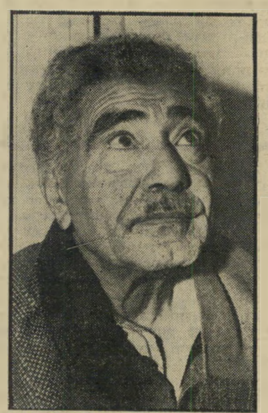
חסריבית מזרחי הגורל התהפך

מוכה-גורל, חסר בית ומיטה. מאז, מקדיש בסאן את זמנו לעזרה לאנשים כאלה.