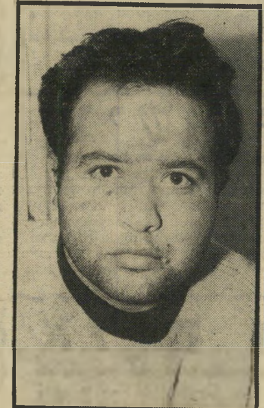
חסריבית כהן המשפחה דחתה

הוא מלך העולם: יש לו מיטה מתחתיו, ותיקרה מעליו. וכי מה עוד צריך האדם כדי להיות מאושר?