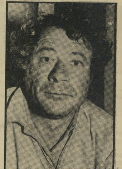
חסריבית אלגוזי האשה עזבה

"המלאכה לא קלה", מספר בסאן (47), ליד ירושלים. "האורחים שלי מאוד קשים לפעמים. יש כאלה שמחזיקים בליים סכינ"גלזה. מיד כשנדרמה להם-שפגעת בהם,