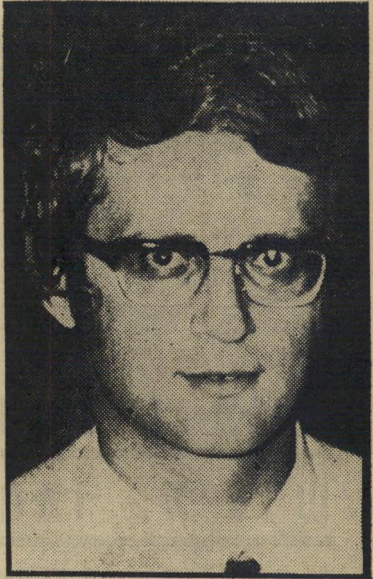
השורן דן ורד בתא של אייכמן

מכות או עיניו בשעת חקירתו. אולם ב"ית־המעצר הוכה בצורה שפגעה בכושר השמיעה שלו. נוסף לכך הושלך כעונש לאח בו היה כלוא אדולף אייכמן. ברור שרק חקירה מוסמכת יכולה לברר מה האמת בטענות החשודים העצורים כי מתעללים בהם ומתאכזרים אליהם. אבל שר־המשטרה שלמה הילל, לא היה זקוק השבוע לחקירה כזאת. ערב צאתו ללונדון קבע החלטית: „אין שמץ של אמת בכל הטענות שהועלו. שהמשטרה או החוקרים מענים את העצורים... כל מה שנעשה ב"ענין זה הוא מזימה והשמצה של אנשי ר"ק"ח וחבריהם שהחליטו, אחרי היסוסים, לקחת את הרשת הזאת תחת חסותם." היו אלה הצהרות נמהרות ומטופשות ב"יותר, שרק הטיפו שמן למדורת ההסתה וציד־המכשפות. לא שר־המשטרה יקבע אם השוטרים הכפופים לו מענים עצורים. הדיברים המורים די הצורך כדי חקירה כזאת, בהשתתפות גורם נייטראלי, ציבורי או שיפוטי, אכן תיערך. השבוע פנתה קבוצה של אישים אל שר־המשטרה, ביקשו חקירה כזאת. יהיה זה מעשה נכון, אם תיענה הר-משלה לבקשה זו. אם תוכיח החקירה שהאשמות הן כוזבות, ירווח לאזרחים רבים, יישמש מכשיר־תעמולה מאוייבי הר-מדינה, יוכח הרצון הטוב של המדינה לברוק ולחקור כל חשש של רבב. אם יתאשרו, לעומת זאת, ההאשמות — מוטב למדינה לפעול במרץ כדי לשים קץ לשיטות פסולות. כי במדינת־חוק, גם הפושע השפל ביותר, המפר את החוק מפעשים המגונים ביותר, זכאי לשמירת החוק כלפיו — גם בידי סוהרים וחוקרים המתעבים את המעשים שהוא מואשם בהם.