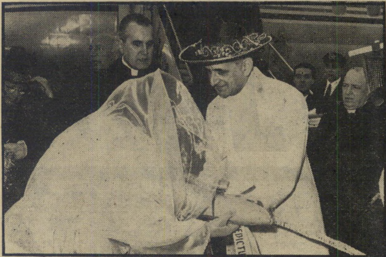
האפיפיור ומבקרתי מ' נתון יד למי?

מדינות במרחב, כשאיורפה החדשה מנסה להתחרות עם ארצות-הברית ר' ברית-המועצות, מודיע האפיפיור על קיומו ככוח נוסף, המעוניין ומסוגל לשחק תפקיד בהשכנת השלום — תוך השגת רווח מדיני לעצמו. כנסייה חכמה יותר, מבחינה זו, חכמה הכנסייה הקאטולית הרבה יותר ממתחרתה המודרנית, הכנסייה הקומוניסטית. אחרי ככלות הכל, יש לה כי 1900 שנות-גיסיון יותר מהאפיפיורים ה' אדומים. מוסקבה שרפה את הגשרים עם ישראל, גורה על עצמה חוסר-אונים לגבי כל אפשרות של תיווך, רומא, לעומת זאת, הפגינה השבוע שיש לה גשרים פתוחים לכל הכיוונים, ושהיא מסוגלת בהחלט לתווך, בשעת-רצון. ספק אם יירשם פרק חדש בספר הי עתיק של יחסי רומי וירושלים. אולם האפשרות נשארת פתוחה — זוהי, בי