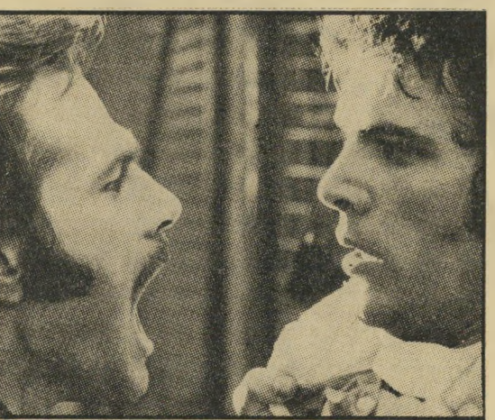
נרו: מספרים רומאיים, גיבורים גרמניים

בסופו, כאשר הרוצח המסוכן נמצא במחיצתו של ילד קטן, בתוך וילה ענקית וריקה מאדם. אם התעללות בילדים היא מן התחביבים שלכם, ודאי תלקקו את השפתיים. אבל מי שאינו סובל מסטייה מסוימת זו — קשה להבין מדוע נראר דווקא סרט זה.