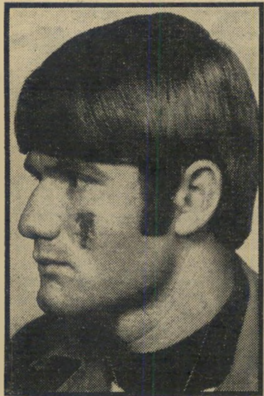
חייל מוכה דהאן

היה זה שיאה — בינתיים — של פאר-סה עגומה, שלולא היתה כל-כך טראגית, היתה יכולה לשמש חומר למחזה נוסף: מה שהתחיל כפעולה שיגרתית-בטיפשו תה של הצנזורה — התפתח לכדור-שלג ענק, שאיים לפגוע קשה בתרבות, הצר לעת למדי גם בלי זה, של המדינה בעיני מיליוני נוצרים ברחבי העולם. עוד לפני סערת-הרחות בקרב העדה הנוצרית בארץ, זכה צינוורו של המחזה