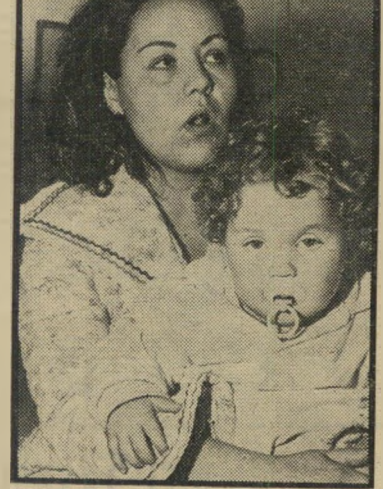
דירת צ'לצ'ינסקי איך לקבור 100 אלף ל"י

חודש וחצי שררה המהומה בבית. כשי נשאלה אמה מדוע לא ביררה את מצב הדירה מקודם, השיבה: "עד שלא נתתי