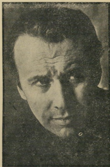
שחקן קילי אחרי הזקנה, מטוס

גל-השמעות. בדבר הסרט הנסיך הקטן כחוזמר. החל כאשר פרנק סינטרה רמז שיהיה מוכן לוותר על קאריירת ה-פנטיונר. על-מנת להופיע בתפקיד ראשי. מאליו ברור, אם יש כבר כוכב כזה, ממחרים לגייס כוחות מתאימים כנגדו: את הבמאי סטאנלי דונן — האיש שעשה עם סינטרה את אחד הסרטים המוסיקליים הטובים ביותר, יום אחד בניו-יורק — וצמד פזמונאי-מלחין, לרנר-לווה, שהציג לחתן מאז גבירתי הנאוה גובלת באגדה. אלא שבינתיים ההליט סינטרה שמוטב לו בכל זאת להשאיר את המשחק לצעיר