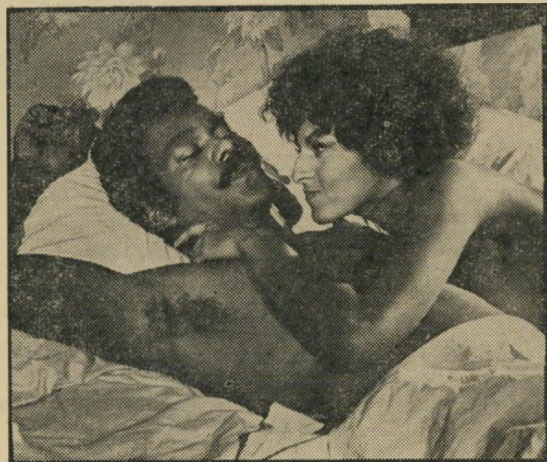
ראסולאלה: כוח שחור במיטה

* Snul-Brothers — כינוי-האחווה הוודני בין כושפים.