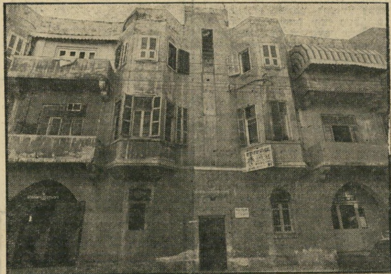
בית-המריבה ברחוב הירקון פרוצות מכוונת —

סכין בכספך. לטענת כספי, שילחה הי חברה העומדת לבנות את המלון — השייכת למשקיע יהודי-גרמני בשם דויד