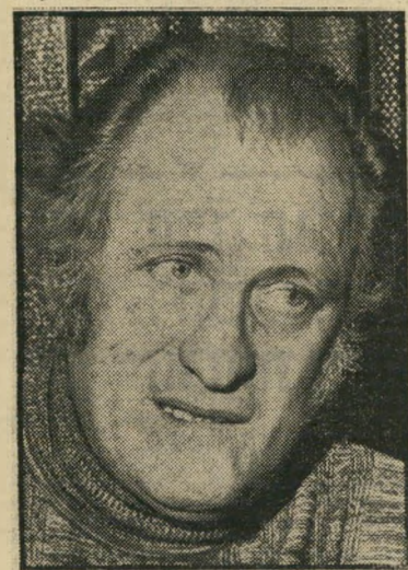
מוסיקאי כספי — אז טבעית?

תלמידים רבים שלי עזבו אותי, כאשר ראו את תנועת הזוגות והלקוחות בבית