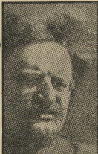
ליאון טרזקני תפקיד המהפכה

לבסוף, חבל שלא פירטתם את תוכנו של הספר שלום שולום ואין שלום שחובר בידי משה מחובר ו- עקיבא אור, ממיסדי קבוצת מצפן המקורית. פירוט זה היה מצביע על הדרך הארוכה שעברו שניים אלה וחבריהם מאז הופעת הספר ועד היום הזה. שכן בספר זה הם מופיעים עדיין עם העמדות המסורתיות של מק"י שלפני הפילוג ב-1965. בספר הם מצדדים בקיום מדינת-ישראל, חוץ כדי הכרה בזכות ההגירה ה- לאומית של ערביי פלסטין. הם מבק- רים קשת את מדיניות החוץ וה- ביטחון של ממשלת-ישראל, וכמובן גם את כל המיפלגות הציוניות מ- שמאל ומימין וזיקות ההדוקה של אימפריאליזם המערבי, החל ממלחמת השיחרור (ההסכם עם המלך עבדאללה על חלוקה ביניהם של ארץ-ישראל המערבית, שלפי תוכנית החלוקה נר- עדה להקמת מדינה ערבית פלסטינית).