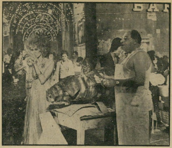
חג הנואנטרי: חזירים זוללים

בתי-הבנוש הרומאיים, תצוגת-האופנה הכמורתית, חפית הרבכת התחתית - כל הסצינות הללו, הנראות כאילו נקלטו במקרה עליידי המצלמה מן המציאות - מבווימות.