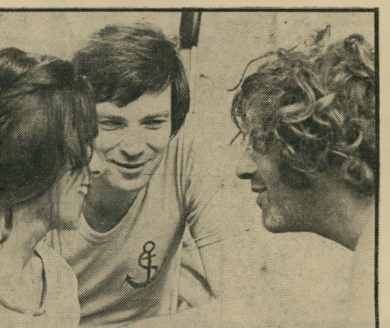
זוהר ואיינשטיין: ילדים מציצים

כביכול, הם ציפורי-ידרו, מורדים במוסכמות ומנהלים את חייהם לפי חוקה פנימית משלהם. אלא שהם אינם נראים מרוצים מכל העניין, או נשברים מהיותם בשולי