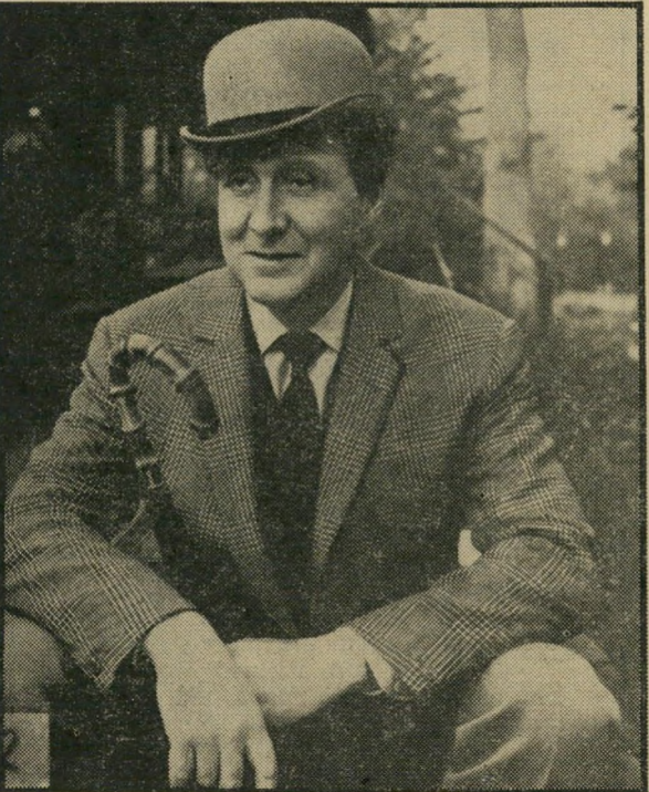
הגומלים: פטריק מקני ודיאנה ריג רוצחים בדבש

הסידרה — נכנסה ישר לגולדפינגר ולי נעליה של פוסי גאלור.