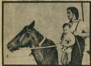
פייסרית וכייכי סיטר בזומנית