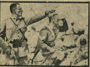
שני פרג'נטים עבריים מסירים את קרכת קוסקוס טבעון