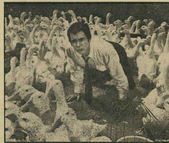
ג'ונס: בוא, ברווז רדיו-אקטיבי!

רק לקראת הסוף, כאשר מגיע הסרט, אחרי הרבה חוכמות פושרות לרדיפה המסורתית שחייבת לסיים כל קומדיה אמריקאית — הוא מתערער קצת לחיים. עד ל' סצינת-השיא, שמהווה דוגמא לא רעה של התעללות בנוער, במסווה של קומדיה בידורית. כל מיני דמויות-מישנה מוכרות מסרטים אחרים, כמו