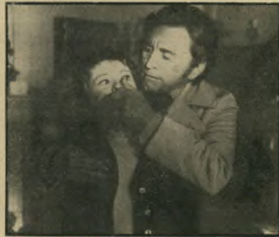
דאגלס ז'ובר: הטבור שבסנטר

פרטים נוספים אין טעם לגלות, אבל צריך לציין את חוש הקצב הנאה שבסרט, את החומור הבריטי שבא לידי ביטוי בהזדמנויות רבות, ואת האהבה הבולטת שיש ל' קלמנט ולחבריו לעצם אומנות הקולנוע.