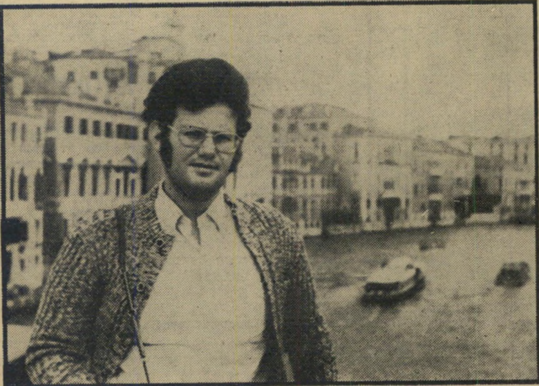
צייר גילדור (בוונציה)

יעקוב ואשתו עזבו את החדר בתי-פזון, לבושים בפיתומות, אך הבדיקה היסור