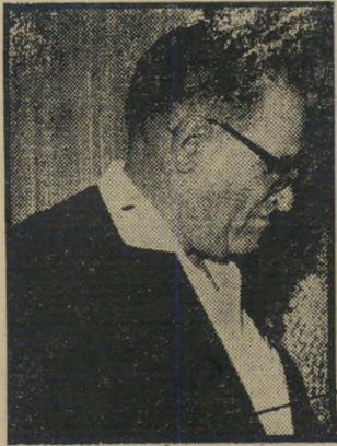
יו"ר יערי לו הכות, לא התחילה

הלאה: כל שנה, מגייסת המזרחי תר"י מות בחו"ל בהיקף של כ-4.5 מיליון ל"י.