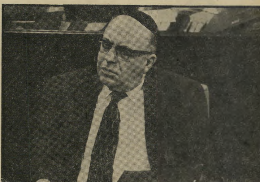
השר יוסף בורג