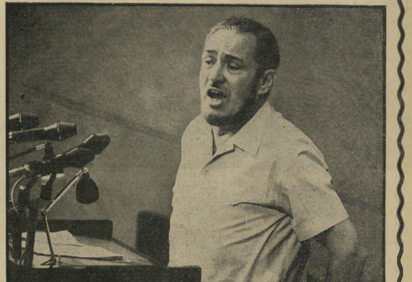
ח"כ אברהם מלמד