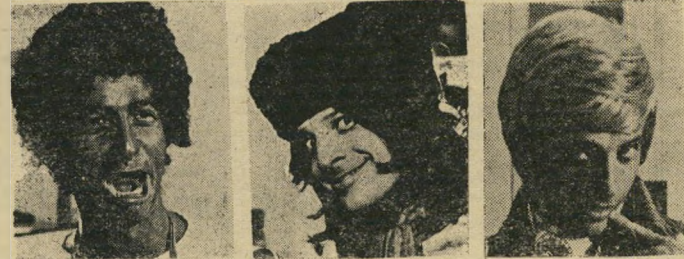
שם הדמות ..... שם הדמות ..... שם הדמות תאור הדמות ..... תאור הדמות ..... תאור הדמות