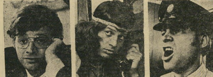
שם הדמות ..... שם הדמות ..... שם הדמות תאור הדמות ..... תאור הדמות ..... תאור הדמות

כדי להשתתף בהגדלת הפרסים עליך למלא את הפרטים מתחת לכל תמונה בצירוף הכרטיס בו בקרת בסרט ולשלוח לת.ד. 23000 תל-אביב, עבור "סרטי נח".