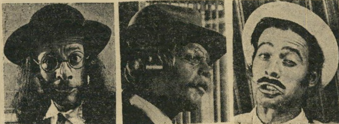
שם הדמות ..... שם הדמות ..... שם הדמות תאור הדמות ..... תאור הדמות ..... תאור הדמות