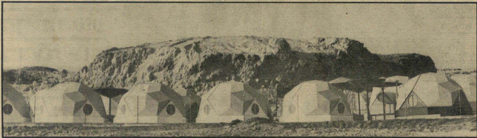
מזון האיגלו בשארם — אנטר —

„מה שכן משגע אותנו, זה רעש הגשם המטפטף על החומר הפלאסטי.“ אומר ארד. „כשיורד גשם בלילה, אני מתעורר