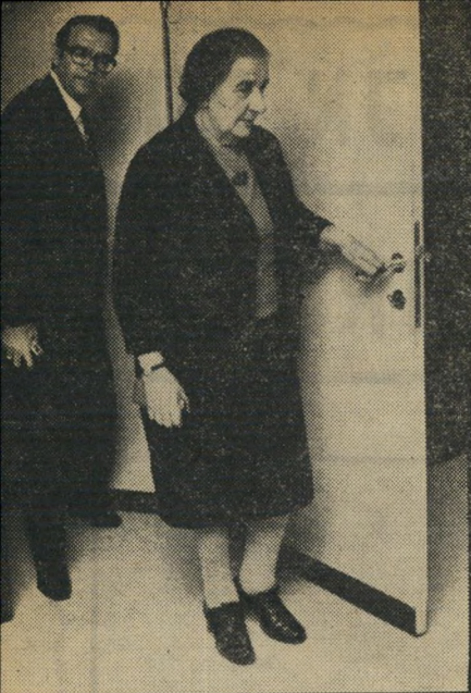
היועץ והמזכיר בלבוש את הצפרדע