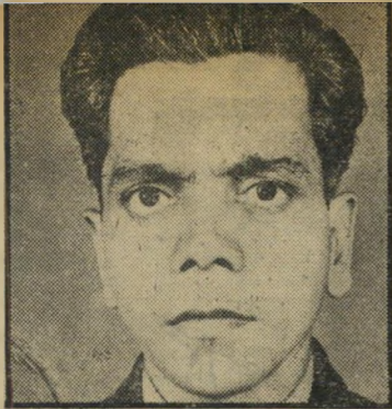
עודה ננאוקי את מי לרצוח?

לעבודה. איש אינו מטפל בהם מלבדי, כתב במכתבי התגוננים ששיגר בחודש אוגוסט השנה לשרי הפנים והקליטה. זה עזר כמו כנסות-רוח למת. הוא קיבל תשובות מתחמקות. שהיפנו אותו ממשדר אחד לשני כדי לברר אם אשתו מתה או רק התגרשה ממנו. השביע עשה סלומון את הצעד הראשון: הוא שיגר מכתב תלונה לנציב התלונות. התלונן על שבגלל טעות של סקיד-רישום מבולבל או מטומטם, צדי-כים שני ילדיו להישאר בלי אם והוא בלי אשה בבית.