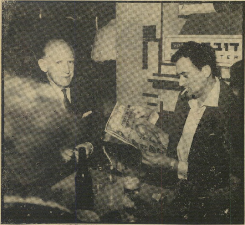
קוראי "העולם הזה" כ"כפית" ב-1961 גליון מיוחד על ישראל בר

הכוונה היא, כמובן, ליחסי הגומלין בין המקום לבין עתון זה. אי אפשר לתאר ולהסביר מה היוותה בזמנו כסית לציבור רחב של בני הארץ הזאת, מבלי להזכיר את העולם הזה, שנים רבות מאוד היה אחד הערבים בכל שבוע.